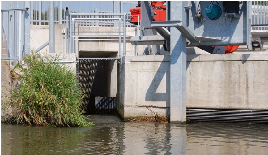
Bild 4: Übergabe des horizontal abgereinigten Treibguts in das Bypassgerinne

werden hier spezielle Kontrollbauwerke installiert, die Fließgeschwindigkeit, Durchfluss, Turbulenz und Scherbelastung abmindern. Dabei handelt es sich um eine Klappe mit vertikaler Drehachse (Türflügelprinzip) sowie um ein unterhalb angeordnetes Überfallwehr (Bild 2).