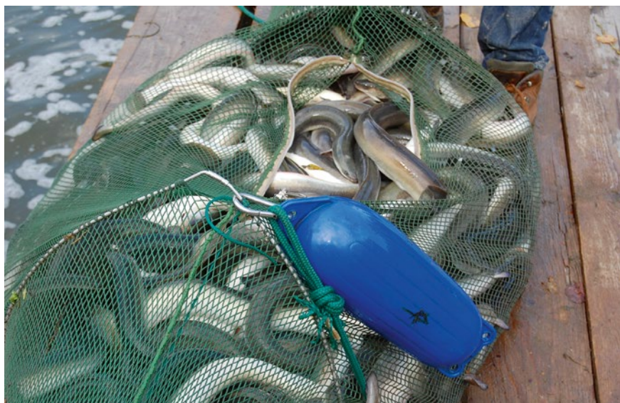
Bild 6: Durch das Leitrochen-Bypass-System erfolgreich in das Unterwasser abgeleitete Aale (Fang aus einer Kontrollnacht)

Standorten mit Ausbaudurchflüssen von 7 bis 88 m 3 /s und Fallhöhen von 1,4 bis 4,5 m praktisch ausgeführt. Durch die bisherigen Betriebserfahrungen, die im Falle der Pilotanlage Halle-Planena, Saale, einen 9-jährigen Zeitraum umfassen, sind folgende Eigenschaften belegt: