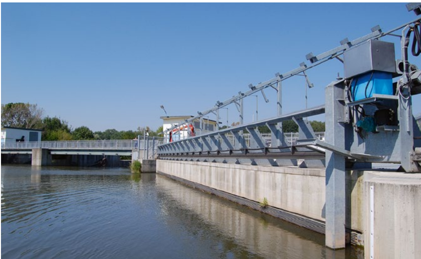
Bild 1: Das Leitrechen-Bypass-System wurde erstmals an der Pilotanlage Halle-Planena (Saale, Deutschland, Ausbaudurchfluss 50 m 3 /s) praktisch ausgeführt

Das durch horizontale Stabelemente gebildete, der Sohle senkrecht aufstehende Rechenfeld wird in einem horizontalen Winkel schräg angeströmt ( Bilder 2 und 3 ). Geeignete Anströmbedingungen werden