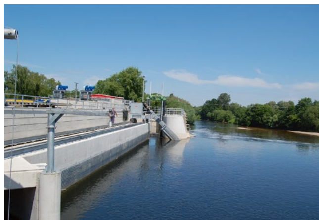
Bild 3: Leitrechen mit Sohleleitwand an einer Wasserkraftanlage mit einem Ausbaudurchfluss von 88 m 3 /s (links: im Bau, rechts: im Betrieb)