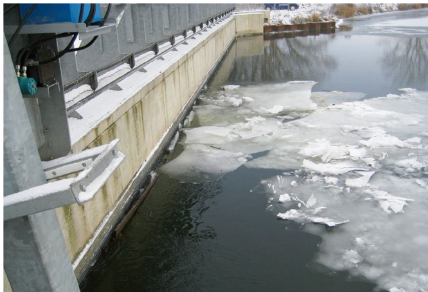
Bild 7: Durch die schräge Anordnung des Rechenfeldes können Eisschollen in vorteilhafter Weise zum Bypass geleitet werden

me eingreifen und hier vorhandene Verkläusungen beseitigen können. Um ein tiefes Eingreifen der Zähne zu ermöglichen, sollten die Rechenstäbe mit kammartigen Blechen auf der Abströmseite und nicht mit Distanzhülsen auf Zugstangen fixiert werden. Die Rechenreinigung kann auch durch spezielle, von der konventionellen Rechteckform abweichende Stabgeometrien unterstützt werden (z. B. Fischbauchprofil). In diesem Fall wird die Zone mit der höchsten Versatzgefährdung auf der Anströmseite des Rechenfeldes und damit in einem Bereich konzentriert, der für die Reinigungsmaschine gut zu-