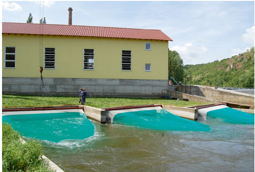
Bild 5: Zur Beprobung der Saugrohraustrittsprofile kamen 3 baugleiche Hamen zum Einsatz

Ausgehend hiervon erfolgten am Standort Rothenburg zusätzlich zur regulären Beprobung der o. g. Wanderkorridore (Untersuchungszeitraum: 4 Tage Frühjahr 2011 und 8 Tage Herbst 2011) auch